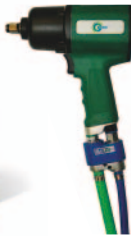
Druckluft-Recycling: Das EARS-System führt die bei Druckluftgeräten üblicherweise nutzlos verpuffende Abluft wieder auf die Ansaugseite des Kompressor zurück. Bestehende Anlagen und Geräte lassen sich auch nachrüsten.

neben jenen Verbrauchern, die viel Druckluft benötigen (Schlagschrauber, Montagewerkzeuge, Farbspritzpistolen, Karosseriewerkzeuge, etc.) vor allem auch jene, die weniger benötigen oder nur zeitweise in Betrieb sind (Grubenheber, Hebebühnen, Reifenmontiergeräte, etc.). Auch externe, an das Druckluftnetz der Werkstatt angeschlossene Entnahmestellen (Waschanlage, Lackierkabinen, Sandstrahlplätze, etc.) sollten man berücksichtigen. Am Ende des ersten Schritts sollten konkrete Angaben über den voraussichtlichen Druckluftbedarf vorliegen, also die effektive Liefermenge in l/min beziehungsweise der benötigte Volumenstrom in \text{m}^3/\text{min} . „Zusammen mit dem erforderlichen Luftdruck – in Nfz-Werkstätten üblicherweise 15 bar – lässt sich damit im nächsten Schritt der geeignete Kompressor auswählen“, erklären die Fachleute von Blitz.