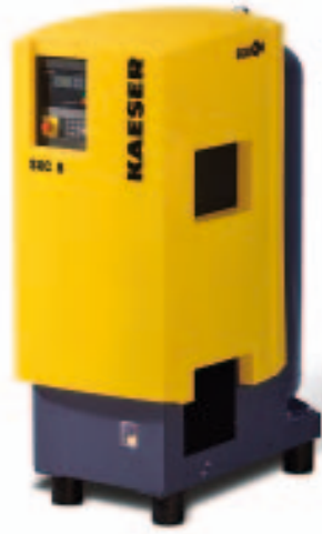
Dauerläufer: Schraubenkompressoren können ohne Ermüdungserscheinungen rund um die Uhr laufen. Mit einer intelligenten Steuerung ist auch ein problemloser Teillastbetrieb möglich. Im Bild eine Kompaktanlage zum „Plug&work“.