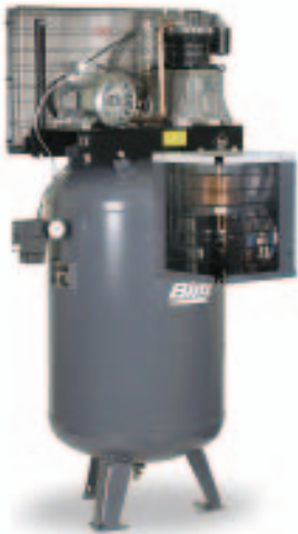
Robust und bewährt: Kolbenkompressoren verrichten in vielen Werkstätten zuverlässig ihren Dienst. Sie werden überwiegend im Start-Stop-Betrieb gefahren und schalten immer dann ein, wenn Druckluft benötigt wird.